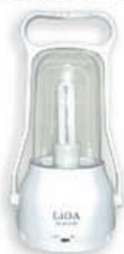
ELQ1X13W/WH Màu trắng White