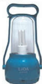
ELQ1X13W/BL Màu xanh Blue