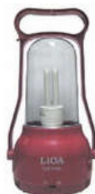
ELQ1X13W/RD Màu đỏ Red