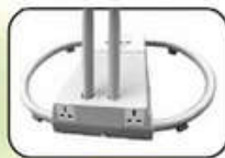
2 Universal outlet socket max 10A